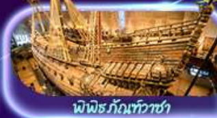
พิพิธภัณฑ์ทว่าซา