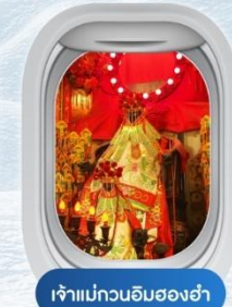
เจ้าแม่กวนอิมของฮ่า