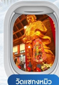
วัดชงหมิว