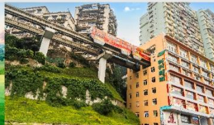
รถไฟทะเลสาบ