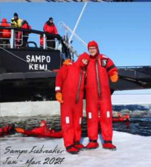
Sampo Icebreaker Jan - Mar 2027