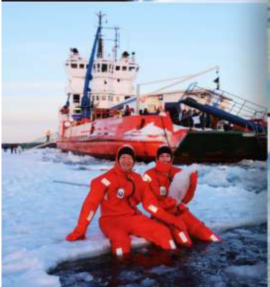
Polar Icebreaker Apr 2027