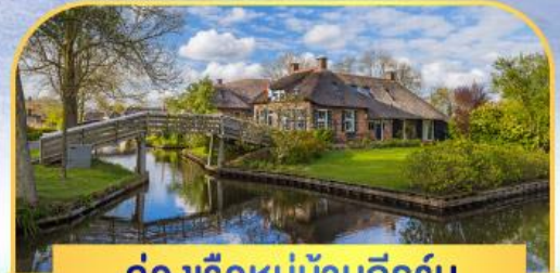
ล่องเรือหมู่บ้านทีรูรัน