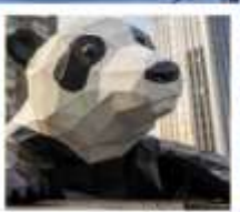
ห้าง IFS หมีแพนด้าเป็นตึก