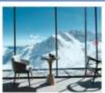
4860 COFFEE SHOP