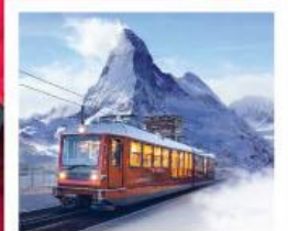
รถไฟเขาคอนเนอร์เกรต