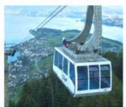
ขึ้นกระเช้ายอดเขาริกิ