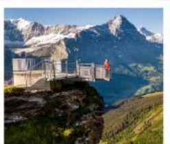
กรีนเดลวาลด์เฟียส