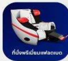
ที่นั่งพรีเมียมแพลนเบต