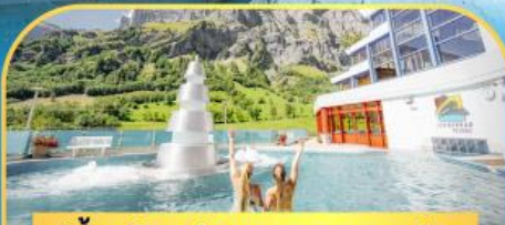
แช่น้ำแร่ร้อนผ่อนคลายยอดคอร์นิต