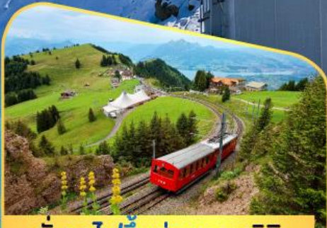
นั่งรถไฟขึ้นสู่ยอดเขาโรติก