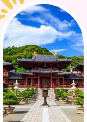
วัดนางชีฉีหลิน สวนหนานเหลียน