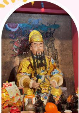
วัดเซกกองเก่าแก่ 600 ปี หยุนหลง

"ไหว้พระ เสริมดวง เพิ่มสิริมงคลแก่ชีวิต"