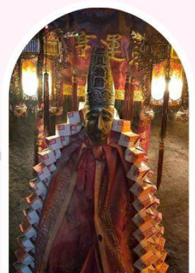
วัดหลินฟ้า โชคลากและความมั่งคั่ง