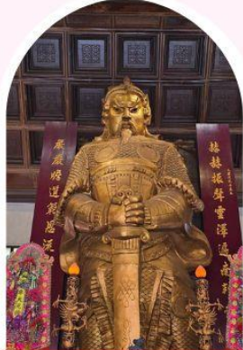
วัดเซก ซาถึน ขอพรโชคลาก การเงิน และธุรกิจ