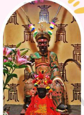
วัดเซกกองเก่าแก่ 400 ปี ไซกง