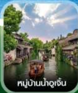
หมู่บ้านน้ำอู๋เจิน