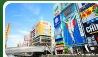
ช้อปปิ้งย่านชินไซบาชิ