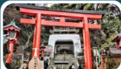
ศาลเจ้าอิโนะชิมะ

01-05 ก.ค.69 15-19, 18-22 ก.ค.69 30 ก.ค.-03 ส.ค. 69