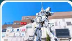
ห้างโตเวอร์ซิตี