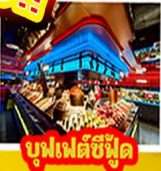
บุฟเฟ่ต์ซีฟู้ด