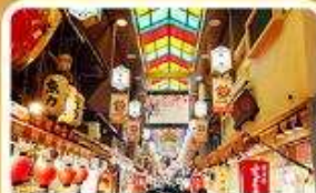
ตลาดปลาชิชิ