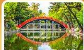
ศาลเจ้าสุมิโยชิ โทคะ