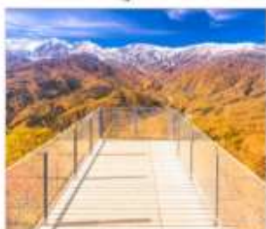
นั่งกระเช้าฮาคูมะ