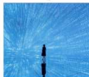
ทีมแค้นแพคนเน็ต