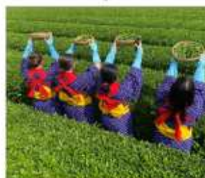
กิจกรรมเก็บชาみやโนเซ็น