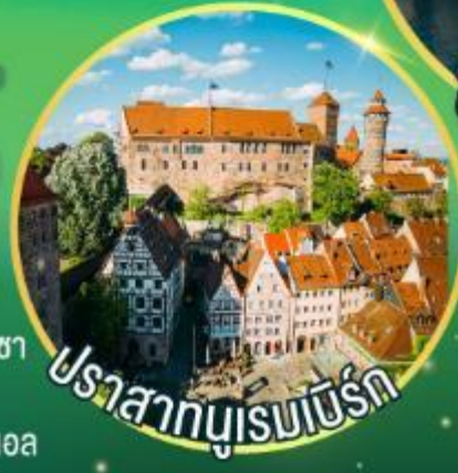
ปราสาทบูเรมเบิร์ก