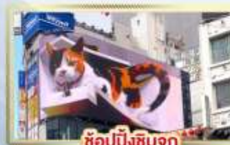
ซูปป์ิงชินจูกุ