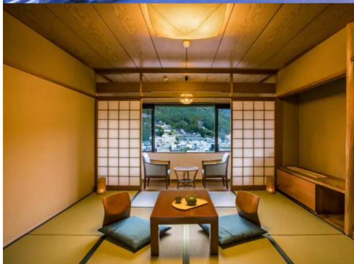
Standard Japanese-style Room 49.5m