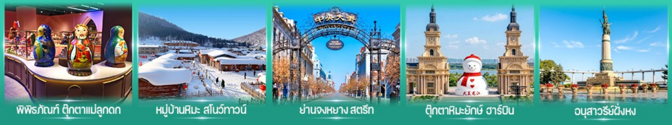
พิพิธภัณฑ์ ตุ๊กตาเป่ลู่กอก