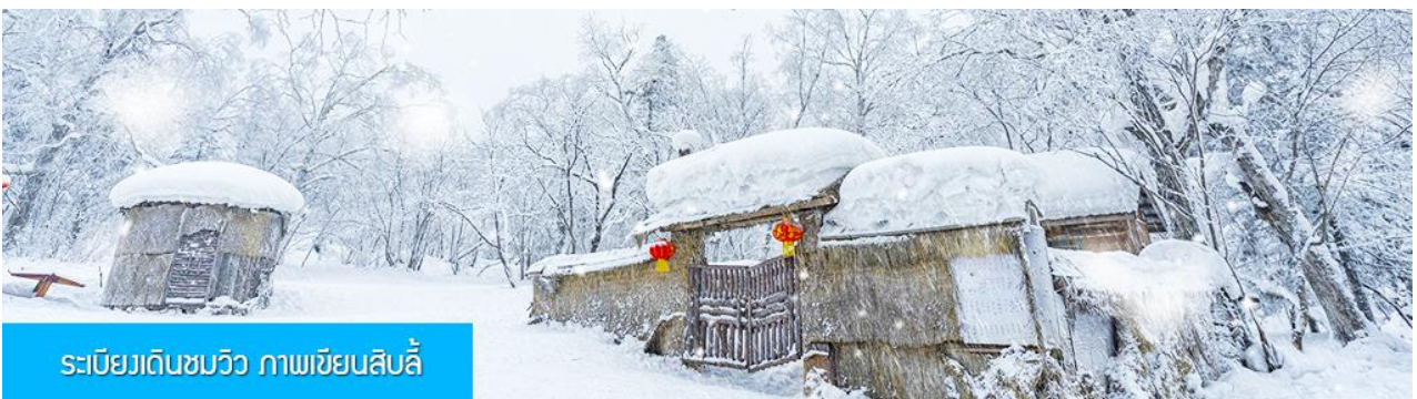
ระเบียบเดินชมวิว ภาพเขียนสิบลี้