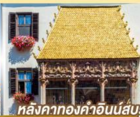
หลังคาทองคำอินน์ส์บรุค