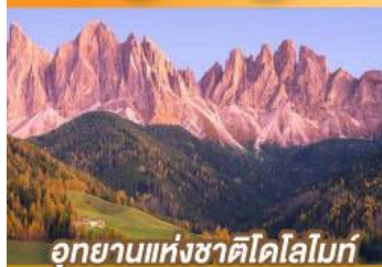
อุทยานแห่งชาติโดโลไมท์

บินตรงนครอัมสเตอร์ดัม กับเส้นทางสายโรแมนติก พร้อมการแสดงพื้นบ้านสไตล์ที่โรเลียนสุดพิเศษ