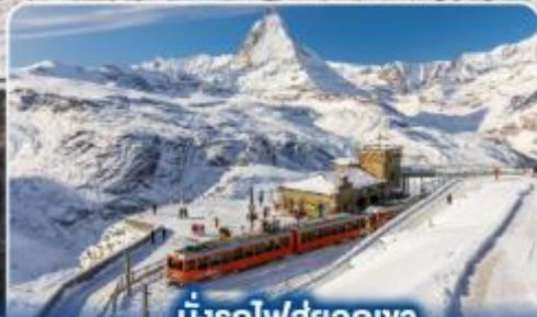
นั่งรถไฟสู่ยอดเขา กรอนเนอร์แกรด์