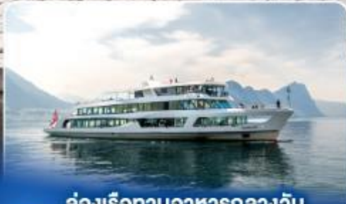
ล่องเรือทานอาหารกลางวัน ทะเลสาบลูซิิร์น