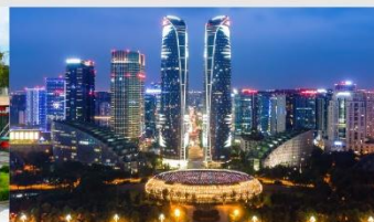
ตึกแฝดเจียงตุ

*ทางบริษัทฯ ขอสงวนสิทธิ์ในการสลับโปรแกรมทัวร์ตามความเหมาะสมขึ้นอยู่กับสถานการณ์หน้างาน โดยคำนึงถึงผลประโยชน์ของลูกค้าเป็นสำคัญ