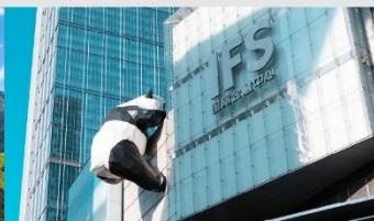
แพนด้ายักษ์ปีนตึก IFS