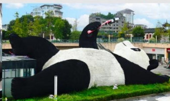
รูปปั้นหมีแพนด้าอนเซลฟี่