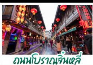
ถนนโบราณจินหลี่