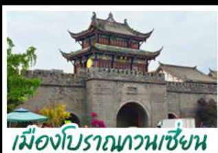
เมืองโบราณทวนเซี่ยน

ภูเขาสิ่วครุณี - อุทยานป่ฝิงโกว - สะพานหนานเฉียว - ร้านหนังสือจงซูเก๋ - เมืองโบราณกวนเสียน จตุรัสเทียนหนู่ - หมี่แพนต้าซาล์ฟ - ถนนโบราณชอยกว้างชอยแคบ - ถนนคนเดินไท่กู๋หลี่ ถนนคนเดินซุนซี - ถนนโบราณจินหลี่ - แพนต้าฮักซิงตึก - น้ำพุไม้ไผ่ตึกSKP - วัดต้าฉือ