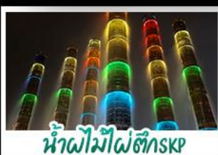
น้ำพุไม้ไผ่ตึกSKP