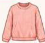
เสื้อสเวตเตอร์ถัก หรือคาร์ดิแกน