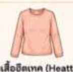
สวมเสื้อฮีตเทค (Heattech) ไร์ด้านในเพื่อเพิ่มความอบอุ่น แทนการใส่เสื้อหลายๆ ชั้น