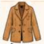
เสื้อแจ็กเก็ต หรือโค้ทตัวยาว