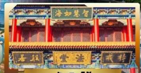
วัดจันทน์