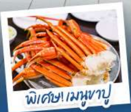
พิซซ่าเมงูนาปู