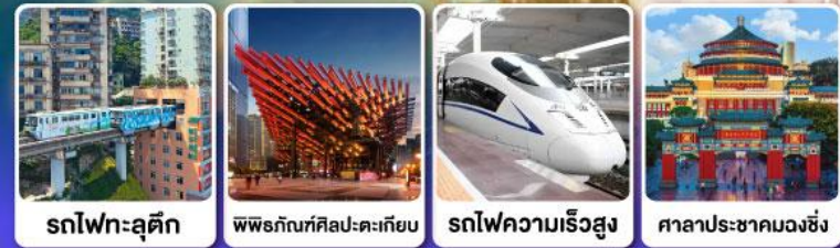
รถไฟอะลุติค พิพิธภัณฑ์ศิลปะ-ตะเกียบ รถไฟความเร็วสูง ศาลาประชาคมฉงชิ่ง