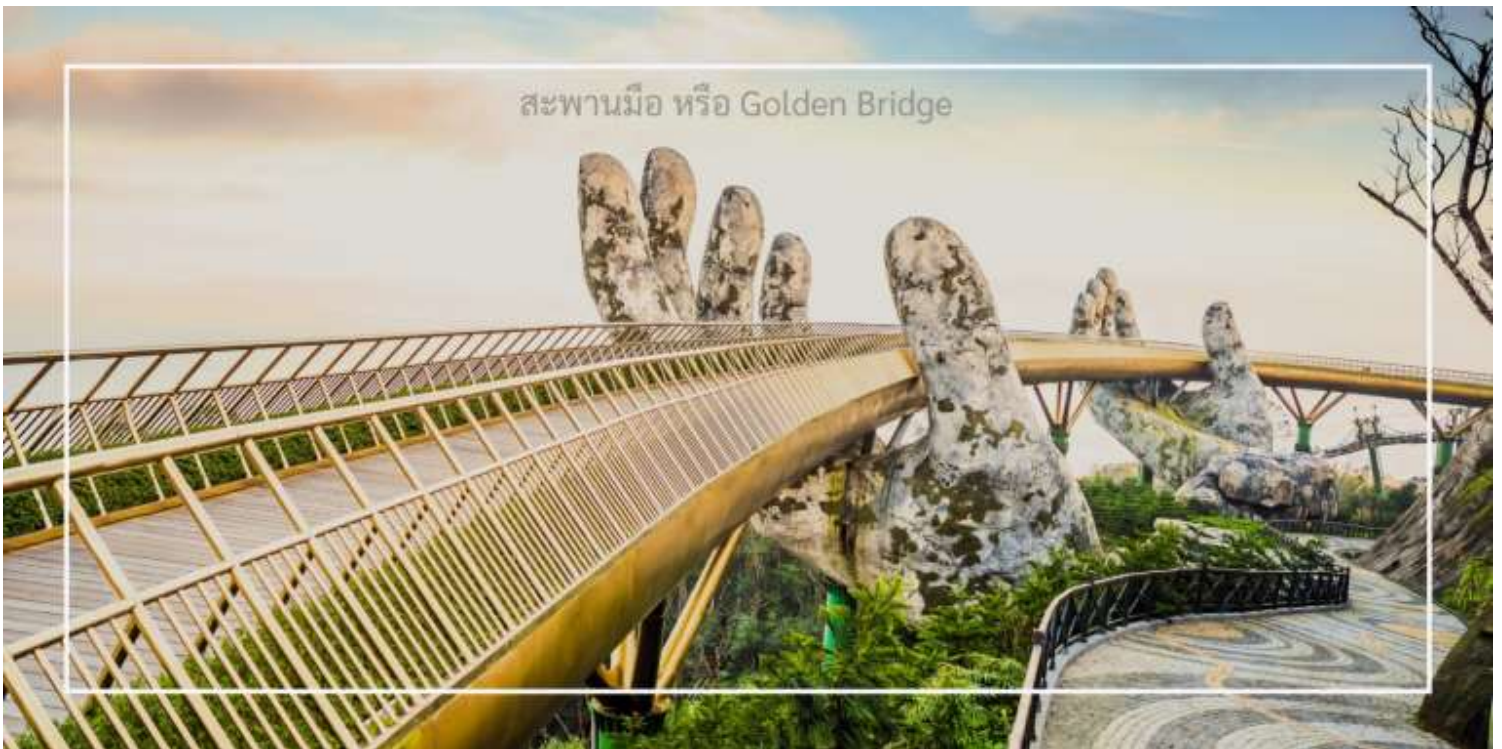
สะพานมือ หรือ Golden Bridge

นำท่านชม สะพานมือ หรือ Golden Bridge สะพานที่ตั้งอยู่บนยอดเขาบานาฮิลล์นี้มีลักษณะโดดเด่นด้วยมือยักษ์ที่ยกสะพานขึ้น ทำให้ดูเหมือนเป็นการเชื่อมต่อระหว่างสวรรค์และโลกมนุษย์ เพลิดเพลินกับวิวทิวทัศน์ที่สวยงามของธรรมชาติรอบๆ และสัมผัสความรู้สึกอันน่าตื่นเต้นเมื่อยืนอยู่บนสะพานที่สูงเหนือเมฆ ที่นี่ไม่เพียงแต่เป็นสถานที่ถ่ายรูปที่ยอดนิยม แต่ยังเป็นสัญลักษณ์ของบานาฮิลล์อีกด้วย