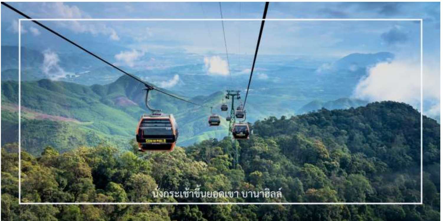
นั่งกระเช้าขึ้นยอดเขา บานาฮิลล์

นำท่านชม สะพานมือ หรือ Golden Bridge สะพานที่ตั้งอยู่บนยอดเขาบานาฮิลล์นี้มีลักษณะโดดเด่นด้วยมือยักษ์ที่ยกสะพานขึ้น ทำให้ดูเหมือนเป็นการเชื่อมต่อระหว่างสวรรค์และโลกมนุษย์ เพลิดเพลินกับวิวทิวทัศน์ที่สวยงามของธรรมชาติรอบๆ และสัมผัสความรู้สึกอันน่าตื่นเต้นเมื่อยืนอยู่บนสะพานที่สูงเหนือเมฆ ที่นี่ไม่เพียงแต่เป็นสถานที่ถ่ายรูปที่ยอดนิยม แต่ยังเป็นสัญลักษณ์ของบานาฮิลล์อีกด้วย