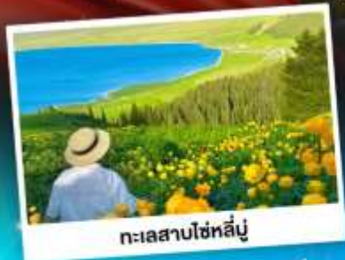
ทะเลสาบไซหลินปู