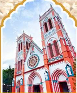
ปอนตีเชอร์