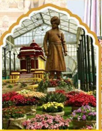
บังกาลอร์