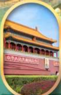
จัสมุติสเทียนอันเหมิน