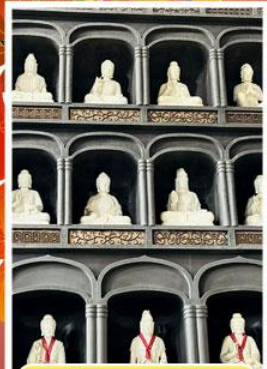
วัดไดชิซังเซอิไดจิ