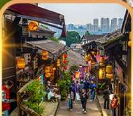
หมู่บ้านโบราณฉือชี่โจว