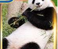
สวนสัตว์จงชิ่ง