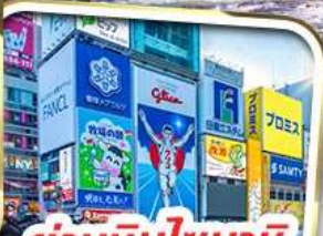
ย่านชินไซบาชิ