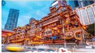
เจียงหยาดัง

อุทยานหลุมบ่อฟ้า - อุทยานเทานางฟ้า หงหยาดัง - นั่งรถไฟทะเลสาบ - อุทยานสี่ดรุณี ปี่ผิงโกว - สะพานหนานเฉียว