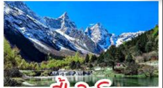
ปี่ผิงโกว