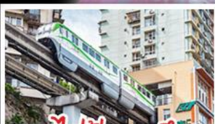
รถไฟฟ้าทะเลลึก