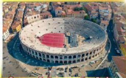
โรงละครโรมันกลางจัหวัดโรม่า