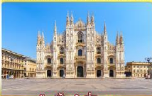
ซอปปิงจุใจที่มิลาน