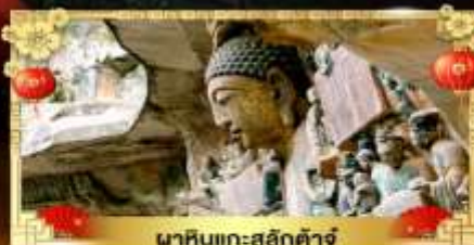
พิพิธภัณฑ์สลักต้าจู่