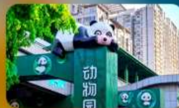
สถานีหมี่แพนด้า