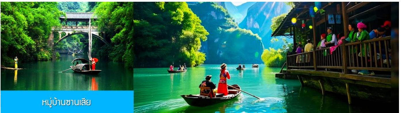
หมู่บ้านชานเสี

พักที่ YICHANG HUIHAO HOTEL โรงแรมระดับ 4 ดาวหรือเทียบเท่าในเมืองหยีซาง