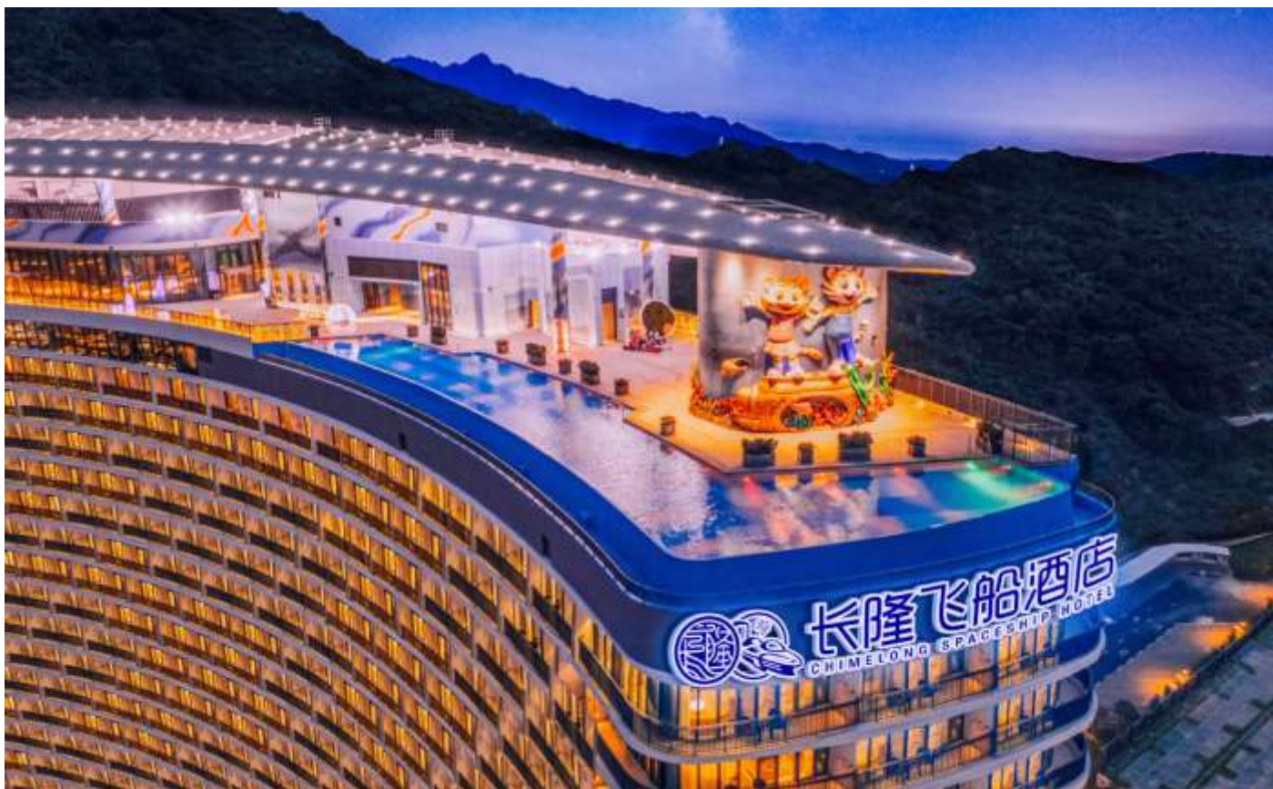
สัมผัสกับการเดินทางอันมหัศจรรย์ หลังจบการแสดง พาท่านเดินทางสู่ห้องอาหาร