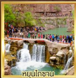
หยุ่นโกซาน