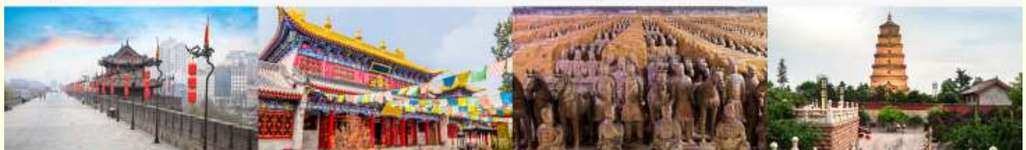
กำแพงเมืองโบราณ