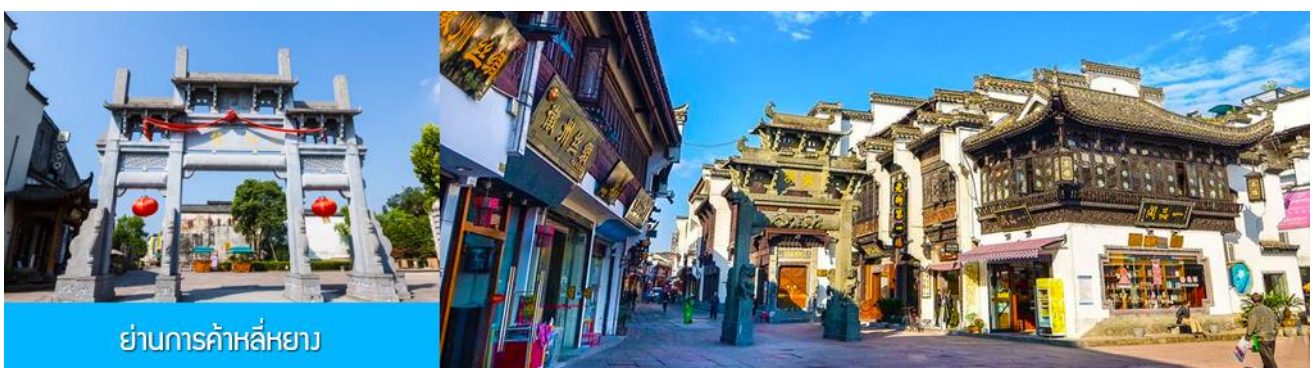
ย่านการค้าลี่หยาง