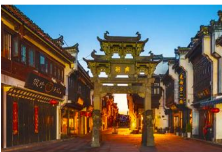
ถนนโบราณกุนซีเหล่าเจีย

หลังอาหารนำท่านนำท่านเที่ยวชม หมู่บ้านโบราณหงซุน 宏村 หมู่บ้านโบราณขึ้นชื่ออายุกว่า 800 ปีที่ได้รับการขึ้นทะเบียนจาก UNESCO ชมบ้านเรือนโบราณกว่า 140 หลัง ที่สร้างขึ้นในยุคราชวงศ์หมิงและราชวงศ์ชิง ที่ยังอยู่ในสภาพที่สมบูรณ์ นำท่านเที่ยวชม และเช้คอิน ณ จุดเช้คอินต่าง ๆ ภายในหมู่บ้าน อาทิ บึงน้ำพระจันทร์ ทะเลสาบหนานหู โรงเรียนหนานหู หอบรรพบุรุษ คลองน้ำหงซุน ต้นไม้โบราณ ฯลฯ