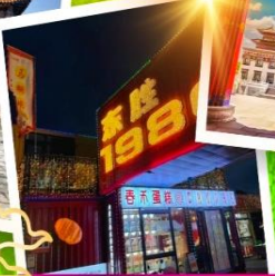
ถนนคนเดินคังบาร์ซี