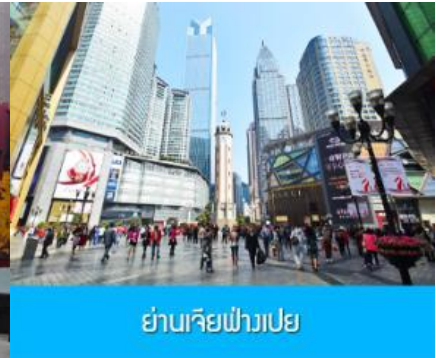
ย่านเจียฟางเปย