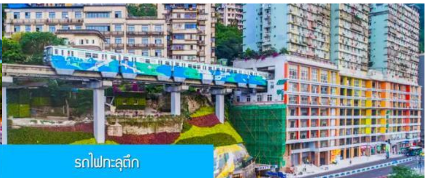
รถไฟฟ้าชุกติ๊ก