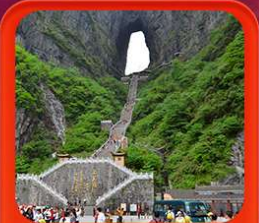
"ถ้ำประตูสวรรค์"