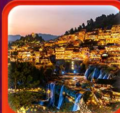
"เมืองโบราณฟูหลงเจิน"