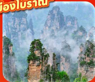
"หุบเขาอวตาร"