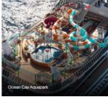
Ocean City Aquapark