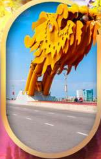
สะพานมังกรดานัง