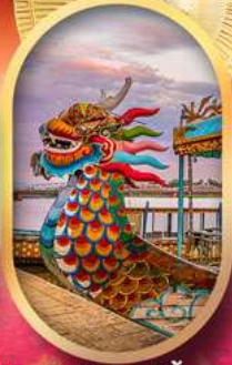
ล่องเรือมังกรแม่น้ำหอม