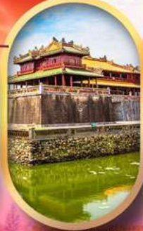
พระราชวังไคโน้ย